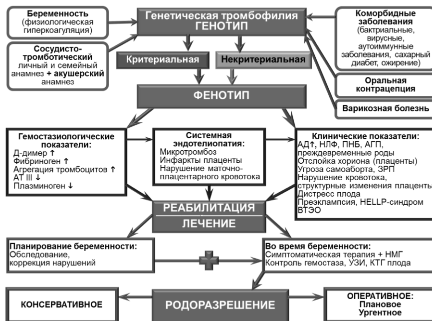
Рисунок 3 – Патогенетическое обоснование алгоритма ведения пациенток с генетической тромбофилией

Генетическое обследование с выявлением мутаций генов, контролирующих гемостаз и фолатный цикл при различных осложнениях гестационного периода, а также установление вариантов комбинаций различных генов позволило идентифицировать тромбофилию как результат снижения естественной противотромботической защиты, активации тромботических механизмов, или сочетания этих факторов, которая при этом может проявляться нетромботическими эффектами, вызывая акушерские и перинатальные осложнения (Рисунок 3).