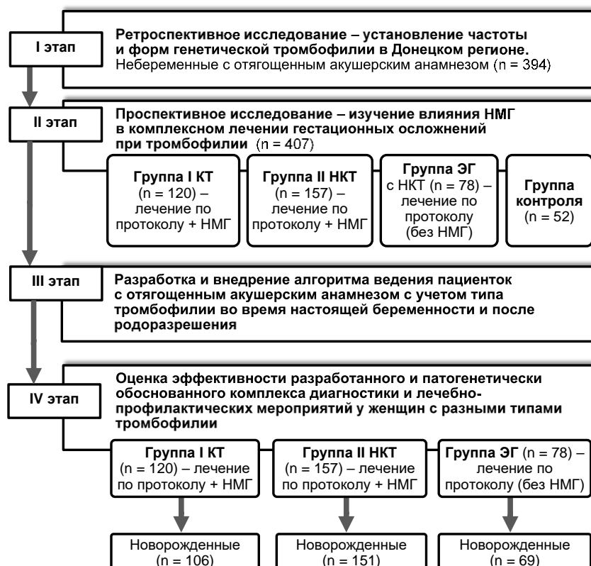
Рисунок 1 – Дизайн исследования

Методология и методы исследования. Для достижения поставленной цели и решения задач была разработана программа исследования, реализующая принцип этапности выполнения работы (Рисунок 1).