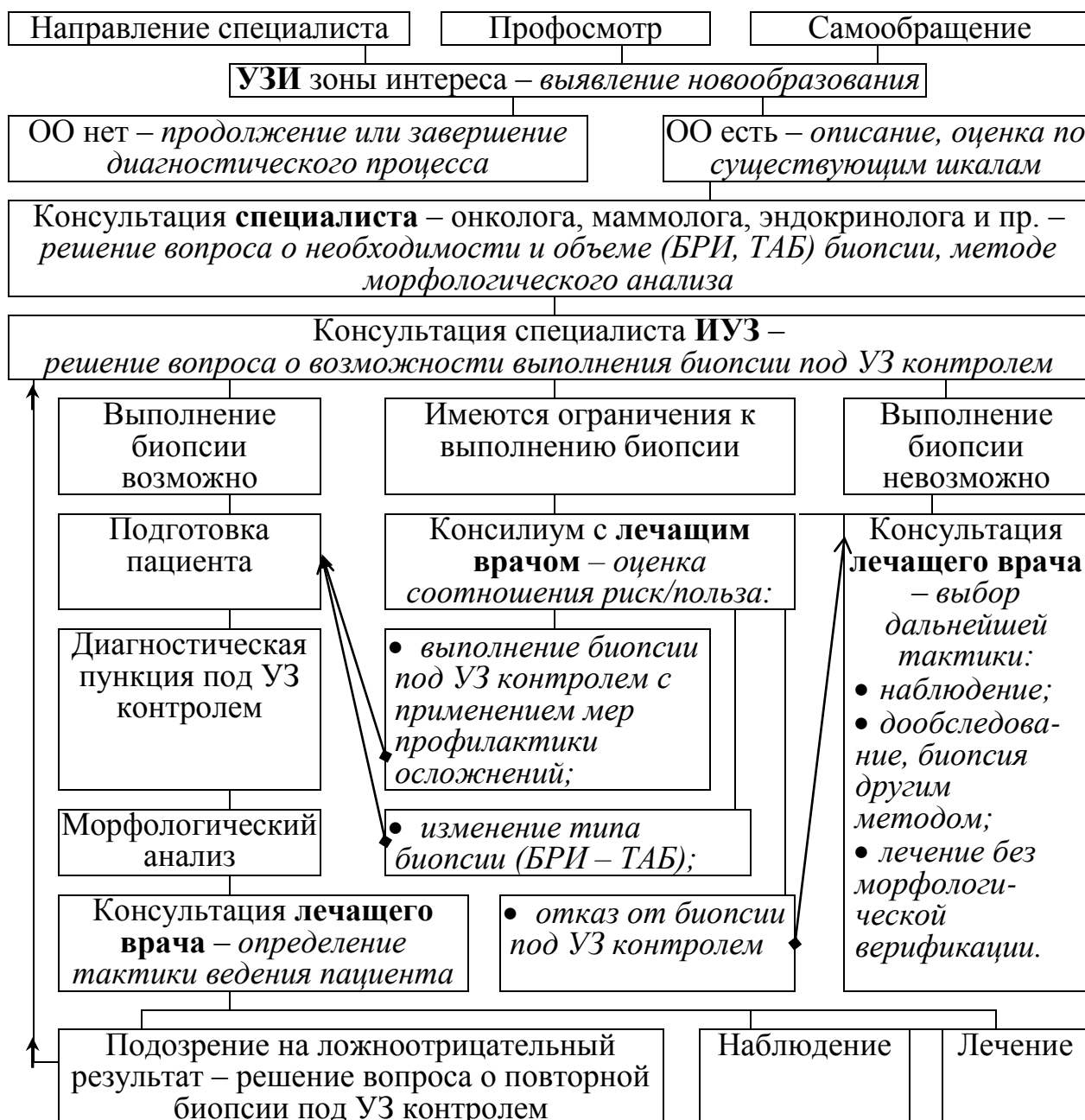
Рис. 1. Оптимальная последовательность действий для верификации объемных образований внутренних и поверхностно расположенных органов посредством эхоконтролируемой пункции

Внедрение предложенного алгоритма, отображающего маршрутизацию пациента при выявлении новообразований, позволило оптимизировать диагностический процесс в 34,0 \pm 3,9\% случаев за счет исключения избыточных биопсий ( 28 \pm 3,7\% ), установления показаний к дополнительным диагностическим вмешательствам ( 2,7 \pm 1,3\% ), коррекции выбора объекта для биопсии ( 2,0 \pm 1,1\% ) и способа лучевой навигации ( 1,3 \pm 0,9\% ).